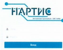
Рисунок 1 – Диалоговое окно стартовой страницы