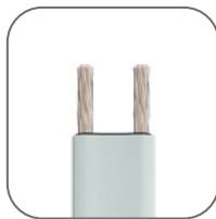
Материал токопроводящих жил – никелированная медь. Матрица не отслаивается от жил