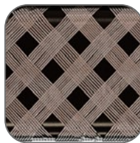
Сечение экрана составляет не менее 1 мм 2 , плотность – не менее 60 %